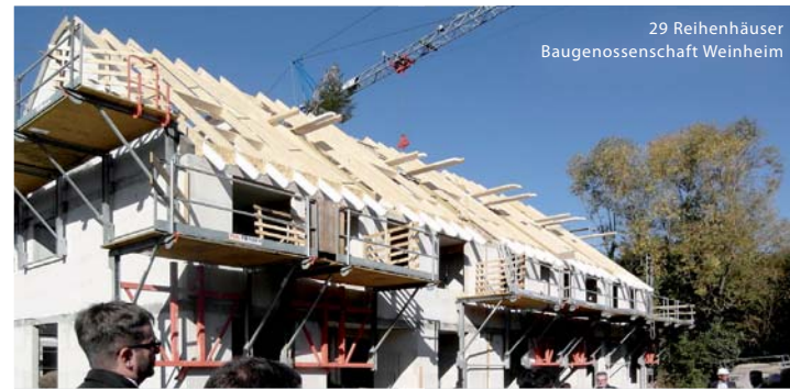
29 Reihenhäuser Baugenossenschaft Weinheim