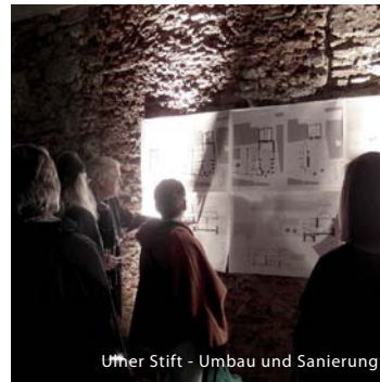
Ulmer Stift - Umbau und Sanierung

idee - nach der umfassenden renovierung soll die kapelle mit einem zeitgemäßen nutzungskonzept, welches sowohl sakrale als auch außerkirchliche nutzung beinhaltet, der öffentlichkeit zugänglich gemacht und damit zur neuen kulturellen begegnungsstätte weinheims werden.