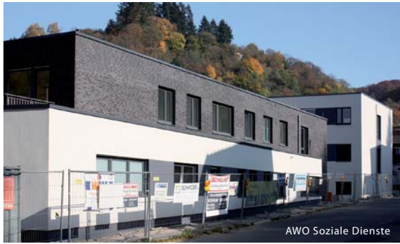
AWO Soziale Dienste

von altenwohnen bis werkstatt - auf ca. 2000m 2 nutzfläche finden die kinderkruppe, eine begegnungsstätte für jung + alt, wohnungen für behinderte, beratungsstellen und pflegedienste, eine tagesstätte mit arbeitstherapie, freizeitangebote für kinder + jugendliche sowie büros platz.