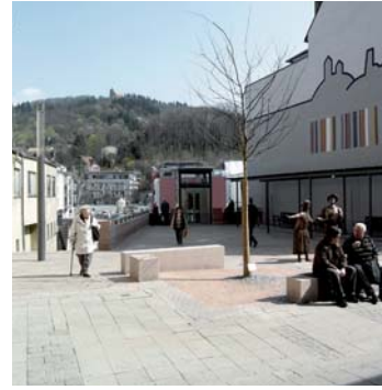
Steg Windeckplatz Stadt Weinheim

um das projekt finanziell zu bewältigen wurden viele spender und sponsoren gefunden: neben dem bund, der aktion mensch, der stadt weinheim und dem kommunalverband jugend und soziales auch die dietmar-hopp-stiftung und die ortsvereine der arbeiterwohlfahrt.